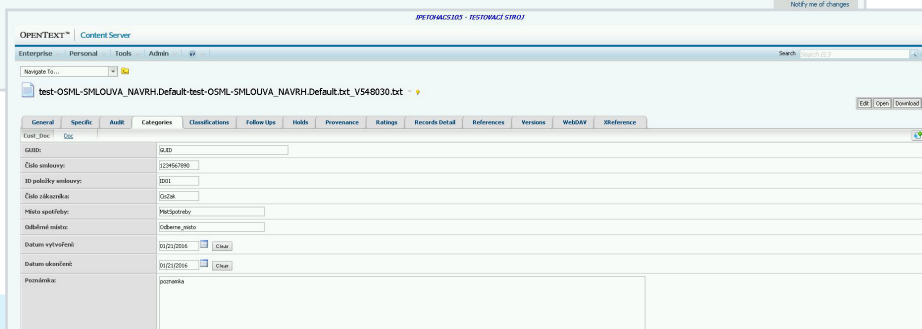
Content Server – vyplněná kategorie