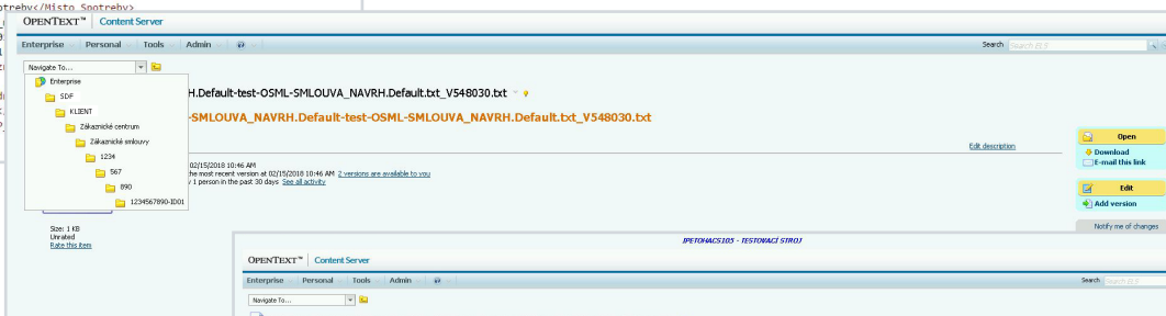
Content Server – generovaná cesta